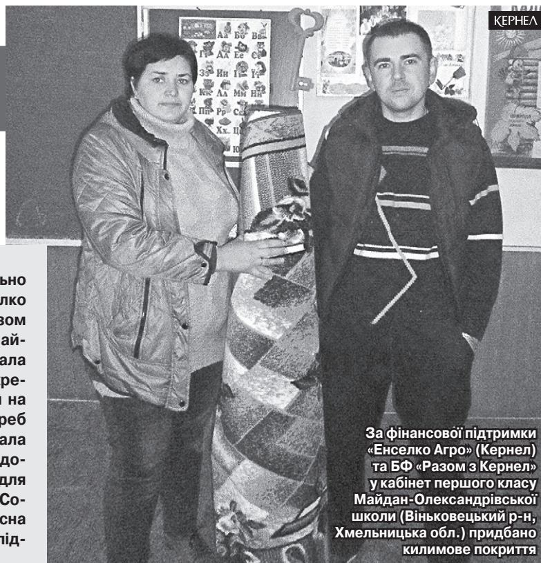
За фінансової підтримки «Енселко Агро» (Кернел) та БФ «Разом з Кернел» у кабінет першого класу Майдан-Олександрівської школи (Віньковецький р-н, Хмельницька обл.) придбано килимове покриття

! У 2015-2016 роках спільно з підприємством «Енселко Агро» (Кернел) та БФ «Разом з Кернел» громада села Майдан-Олександрівський реалізувала чимало корисних справ. Зокрема, Компанія направляла кошти на придбання дизпалива для потреб села та його жителів, допомагала зі щебенем для грейдеравання доріг, купувала меблі (ліжечка) для вихованців дитячого садочка «Сонечко». Також надавалася адресна допомога селянам, пайовикам підприємства.