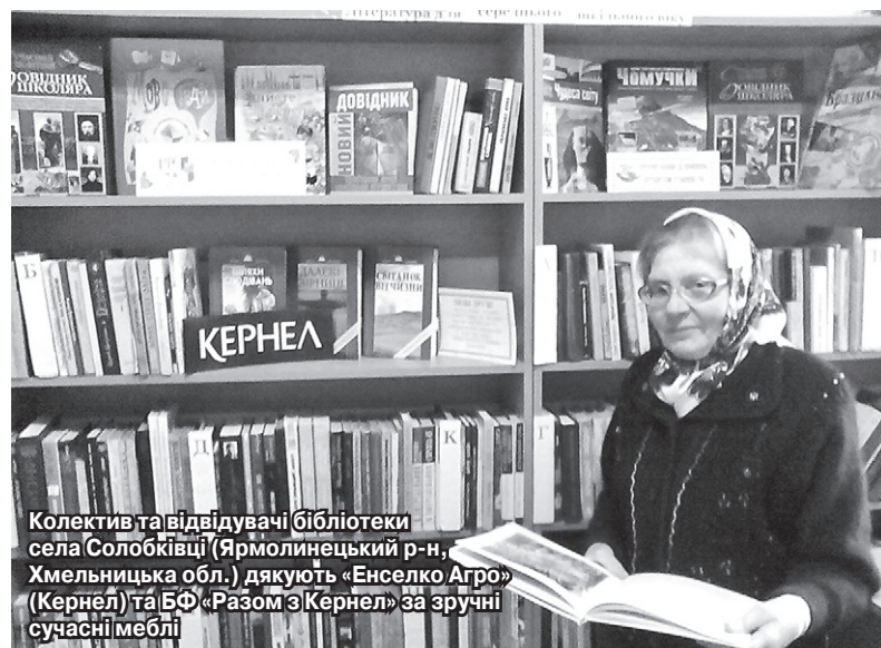
Колектив та відвідувачі бібліотеки села Солобківці (Ярмолинецький р-н, Хмельницька обл.) дякують «Енселко Агро» (Кернел) та БФ «Разом з Кернел» за зручні сучасні меблі

Напевно, не кожне село Хмельниччини зможе похвалитися активною діяльністю бібліотеки на своїй території. У Солобківцях (Ярмолинецький р-н, Хмельницька обл.) такий заклад функціонує вже понад 90 років. А нещодавно за кошти від «Енселко Агро» (Кернел) та БФ «Разом з Кернел» сюди придбано сучасні меблі.