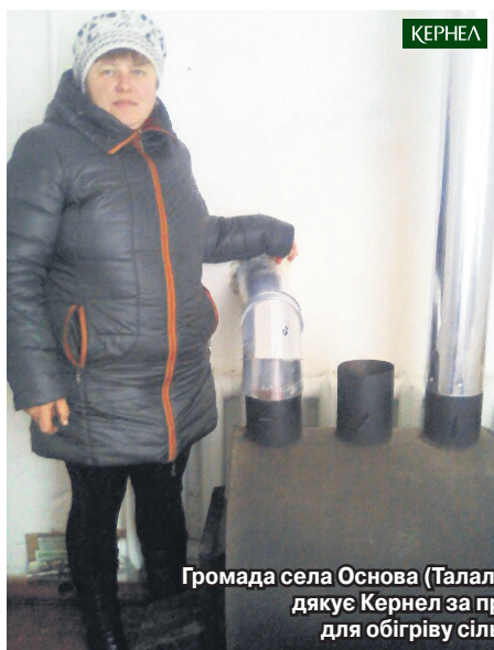
Громада села Основа (Талалаївський р-н, Чернігівська обл.) дякує Кернел за придбання обладнання для обігріву сільського БК та ФАПУ

«Після реорганізації на території смт Варва розпочав свою роботу Варвинський районний військовий комісаріат. Приміщення установи введено в експлуатацію ще за радянських часів. Зрозуміло, що система опалення тут потребувала покращення, адже старий котел вийшов із ладу й не забезпечував