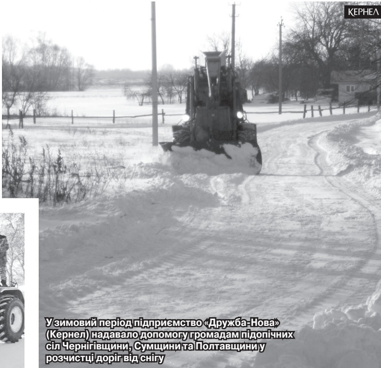
У зимовий період підприємство «Дружба-Нова» (Кернел) надавало допомогу громадам підопічних сіл Чернігівщини, Сумщини та Полтавщини у розчистці доріг від снігу