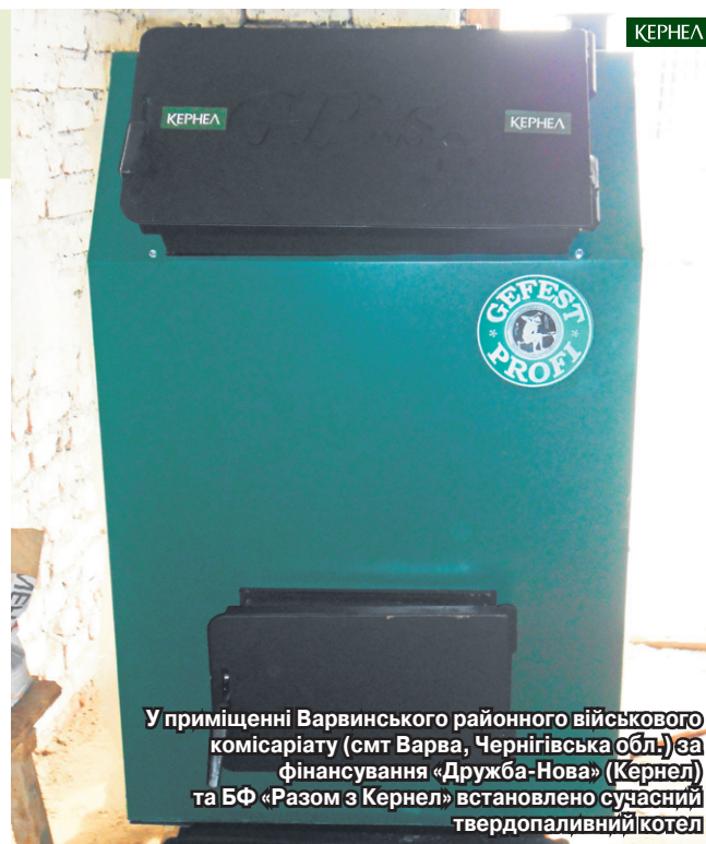
У приміщенні Варвинського районного військового комісаріату (смт Варва, Чернігівська обл.) за фінансування «Дружба-Нова» (Кернел) та БФ «Разом з Кернел» встановлено сучасний твердопаливний котел

проведення поточних ремонтів у сільській школі, крім того, до новорічно-різдвяних свят наші дітки отримували солодощі від Кернел. Дякую аграріям за надану допомогу, сподіваюся, що цього року разом з Компанією ми реалізуємо не один корисний для села та його жителів проект».