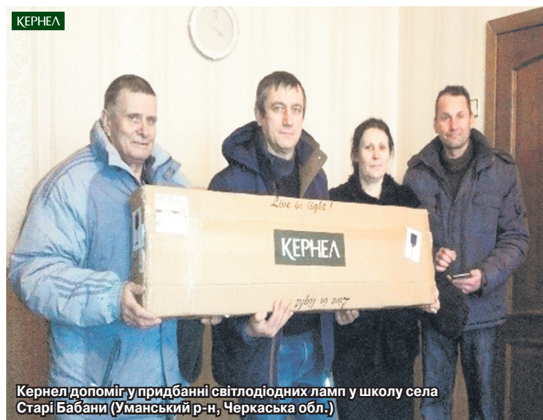
Кернел допоміг у придбанні світлодіодних ламп у школу села Старі Бабани (Уманський р-н, Черкаська обл.)