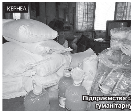
Підприємства «Хлібороб» (Кернел) та «Агросервіс» (Кернел) надали гуманітарну допомогу мешканцям Авдіївки (Донецька обл.)

Ананіївщині на наш запит відгукнулися всі сільгосптоваровиробники району та керівники переробних підприємств, зокрема й підприємство «Агросервіс» (Кернел), — коментує наш співрозмовник. — Фактично за добу нам вдалося зібрати продукти харчування й передати їх постраждалим від обстрілів жителям Авдіївки. Дякую всім за розуміння та оперативність!