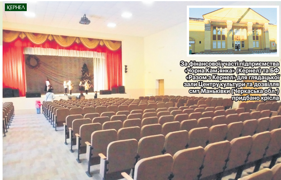
За фінансової участі підприємства «Чорна Кам'янка» (Кернел) та БФ «Разом з Кернел» для глядацької залі Центру культури та дозвілля смт Маньківки (Черкаська обл.) придбано крісла

Підкреслимо, що Кернел спрямував на даний проект 20 тис. грн. У результаті Центр культури та дозвілля Маньківщини отримав зручні крісла.