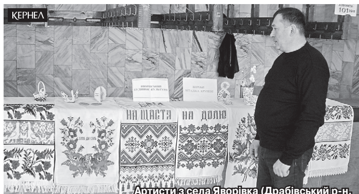
Артисти з села Яворівка (Драбівський р-н, Черкаська обл.) взяли участь у щорічному конкурсі-огляді «Таланти твої, Драбівщино»