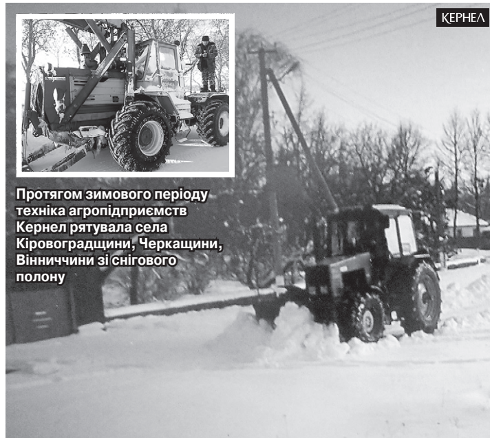
Протягом зимового періоду техніка агропідприємств Кернел рятувала села Кіровоградщини, Черкащини, Вінниччини зі снігового полону

«Я як пайовик підприємства «Осіївське» (Кернел) хочу від себе особисто та від мешканців нашого села подякувати Компанії за допомогу в розчистці транспортних артерій від снігу. Завдяки