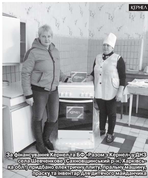
За фінансування Кернел та БФ «Разом з Кернел» у ДНЗ села Шевченкове (Сахновщинський р-н, Харківська обл.) придбано електричну плиту, пральну машину, праску та інвентар для дитячого майданчика