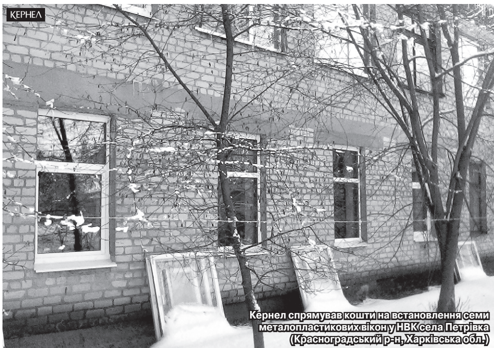
Кернел спрямував кошти на встановлення семи металопластикових вікон у НВК села Петрівка (Красноградський р-н, Харківська обл.)

опалення. Зрозуміло, що проект досить дорогий. До його реалізації долучилося чимало спонсорів, у тому числі орендарі землі, сільська влада. Серед них підприємство «Юнігрейн-Агро» (Кернел) та Благодійний фонд «Разом з Кернел». Вони спрямували на цю справу 32 тис. 800 грн. У результаті спільними зусиллями встановлено сучасний твердотопливний котел у приміщенні НВК. Це передусім сприятиме економії коштів на опаленні та забезпечить комфортні умови для перебування дітей у закладі. Хочу подякувати всім нашим помічникам. Щодо Кернел — переконаний, що ці аграрії надалі інвестуватимуть у соціальну сферу наших сіл. У планах — за кошти від Компанії встановити дитячий майданчик у садочку або ж обгородити парканом сільське кладовище».