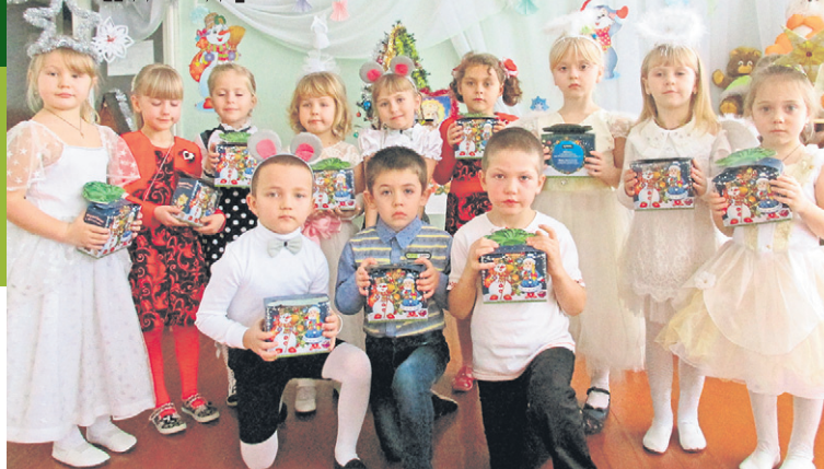
У Петрівський НВК (Красноградський р-н, Харківська обл.) завітали кернелівські Діди Морози з солодкими подарунками