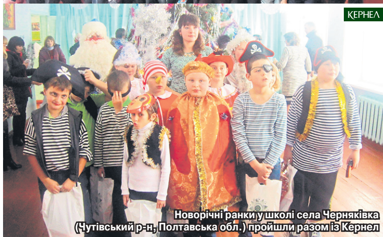
Новорічні ранки у школі села Черняківка (Чутівський р-н, Полтавська обл.) пройшли разом із Кернел