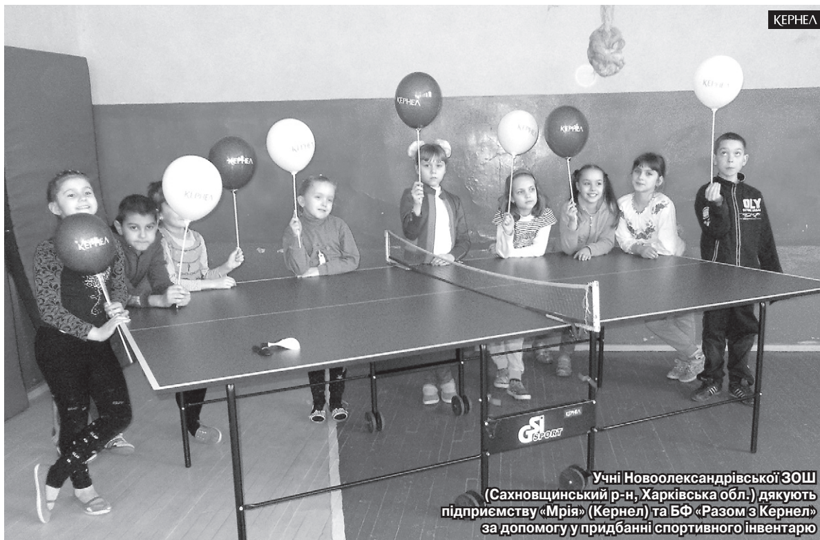
Учні Новоолександрівської ЗОШ (Сахновщинський р-н, Харківська обл.) дякують підприємству «Мрія» (Кернел) та БФ «Разом з Кернел» за допомогу у придбанні спортивного інвентарю

«Почну з того, що у 2016 році співпраця з підприємством «Мрія» (Кернел) та Благодійним фондом «Разом з Кернел» була доволі інтенсивною. Восени завдяки фінансуванню Компанії нам вдалося облаштувати ганок (на придбання будівельних матеріалів Кернел виділив близько 20 тис. грн). Кернелівці організували для наших