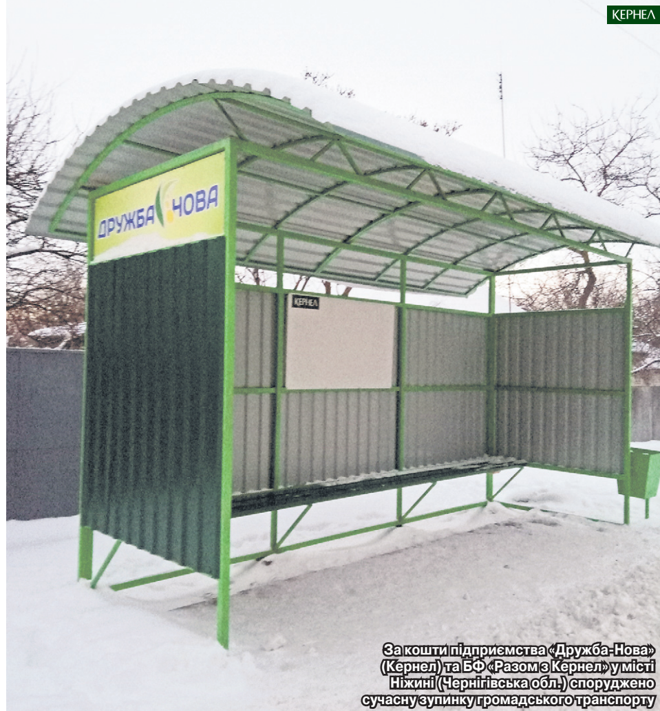
За кошти підприємства «Дружба-Нова» (Кернел) та БФ «Разом з Кернел» у місті Ніжині (Чернігівська обл.) споруджено сучасну зупинку громадського транспорту

— Це дуже гарна практика, коли орендар всебічно підтримує пайовиків, створює якісні умови для життя, — уточнює наша співрозмовниця. — Що стосується розрахунку за паї, тут кернелівці також працюють з думкою про людей. У 2016-му ми отримували пшеницю, кукурудзу, солому. А оскільки тримаємо господарство, то така продукція є просто необхідною. Дякую працівникам Компанії за всі добрі справи, за те, що не залишають поза увагою наші проблеми.