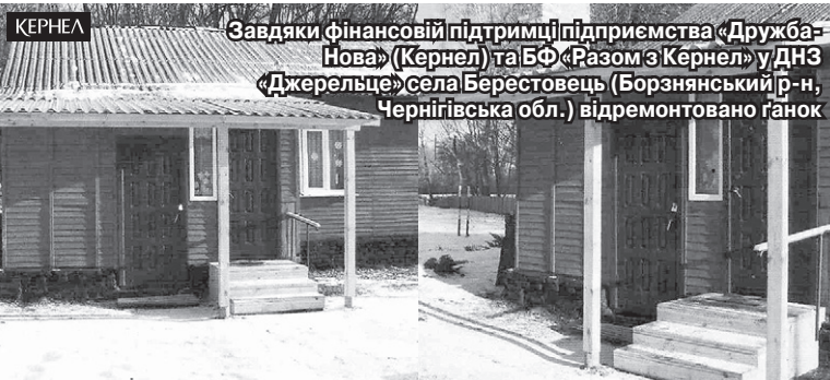
Завдяки фінансовій підтримці підприємства «Дружба-Нова» (Кернел) та БФ «Разом з Кернел» у ДНЗ «Джерельце» села Берестовець (Борзнянський р-н, Чернігівська обл.) відремонтовано ґанок