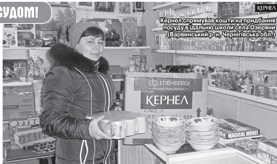
Кернел спрямував кошти на придбання посуду в їдальню школи села Озеряни (Варвинський р-н, Чернігівська обл.)

Так, у 2016 році завдяки коштам від Кернел озерянська громада змогла збудувати в селі торговель-