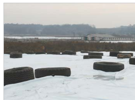
рис робіт склав понад 160 тис. грн. Всього, станом на сьогодні, загальна сума витрат на підготовку до зимівлі ферм Дружба-Нова складає 332 тис. грн.

На сьогоднішній день тільки на Варвинському молочному комплексі проведено капітальний ремонт корпусу для утримання телят, ремонти тваринницьких приміщень, систем водопостачання та видалення гною із заміною застарілих комунікацій. Кошто-